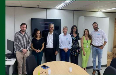
Reunião Abrasem/ Mapa