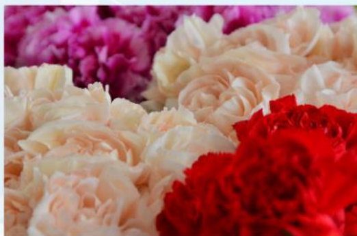
Clavel de Colombia