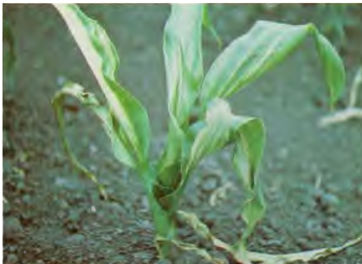
Figura 1: Mancha acuosa continúa desarrollándose a lo largo de las nervaduras (De León, 1984).