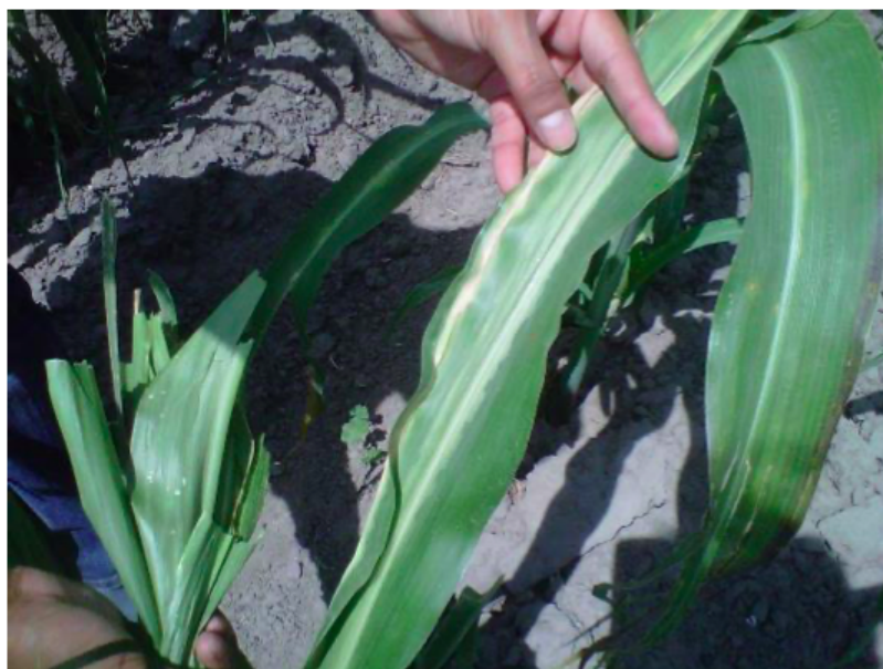
Figura 3: Infección sistémica en plantas en campo (Mezzalama, 2016).