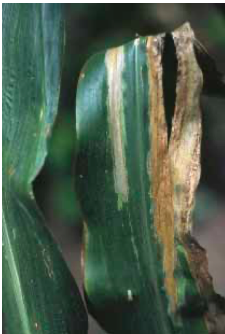
Figura 5: La infección al final del ciclo de cultivo causa necrosis foliar grave pero no marchitez (CIMMYT, 2004).