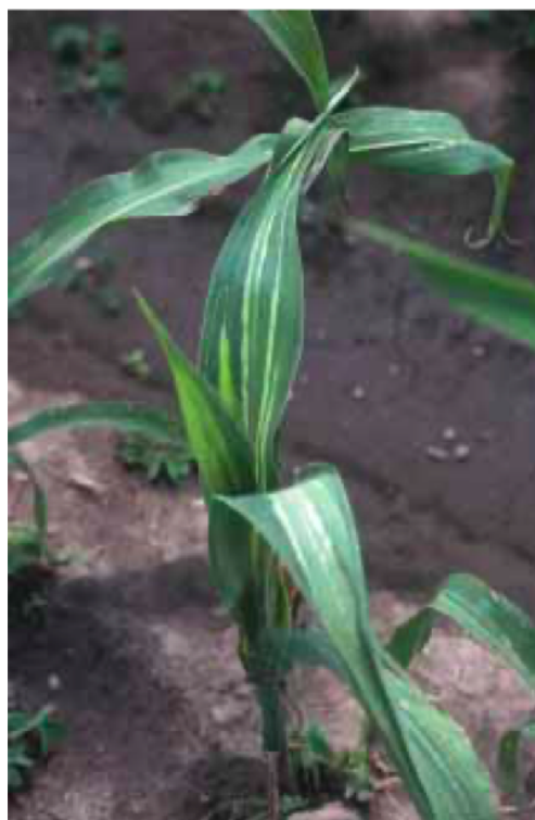
Figura 2: Lesiones de aspecto acuoso, con un margen irregular a lo largo de las nervaduras; a menudo se tornan amarillas y se extienden hacia el tallo (CIMMYT, 2004).