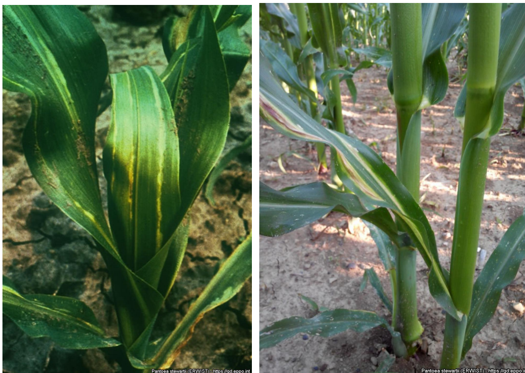
Figura 7: Planta de maíz exhibiendo síntomas de Pantoea stewartii subsp. stewartii en hoja (EPPO, 2020).