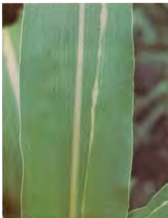
Figura 4: El daño puede diseminarse sistemáticamente en el tallo y causar el marchitamiento total de la planta (De León, 1984).