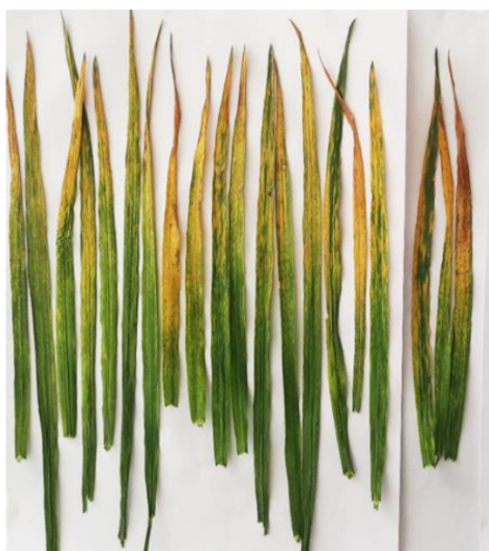
Figura 4: Síntomas del Wheat streak mosaic virus (WSMV), mosaico estriado clorótico en hojas y distintos grados de necrosis en trigo (Alemandri et al. , 2022).