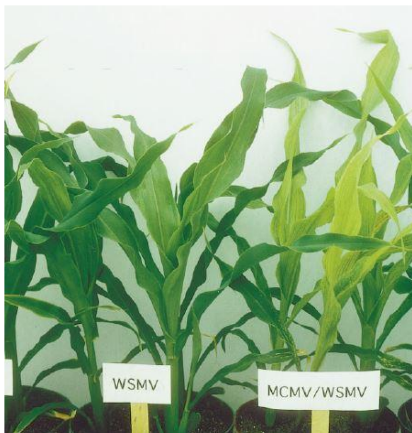
Figura 3: Planta de Zea mays inoculada con Wheat streak mosaic virus (WSMV) (izquierda) y con WSMV y Maize Chlorotic Mottle Machlomovirus (MCMV) (derecha). Se puede apreciar las estrías cloróticas en todas las plantas, lo cual está acentuado en aquellas inoculadas con ambos virus (Scheets, 1998).